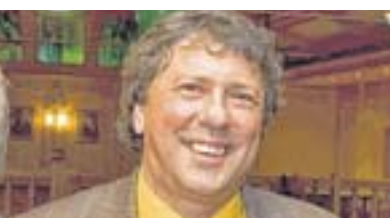
Uwe Schummer

GREFRATH (RP) Am Dienstag, 7. September, findet die nächste Bürgersprechstunde mit dem Kreis Viersener Bundestagsabgeordneten Uwe Schummer um 16 Uhr im Edith-Stein-Haus, Markt 6, in Grefrath, statt. Interessierte sind herzlich eingeladen. Bei dieser Sprechstunde wird zudem ein Mitglied der CDU-Fraktion anwesend sein, um Fragen, die explizit die Gemeinde Grefrath betreffen, zu beantworten oder Anfragen weiterzuleiten. Da die Bürgersprechstunde erfahrungsgemäß stets gut besucht wird, wird vorab um eine Terminvereinbarung bei der CDU-Kreisgeschäftsstelle in Viersen unter der Telefonnummer ☎ 02162 29011 gebeten.